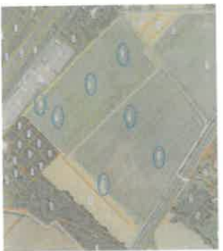
Les Parcelles de la Cabane, parcelles cadastrées BS 75, 76, 77 et 78 et Les Terres du Pont, parcelles cadastrées BS 73, 74 et 79