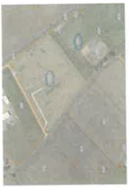
Les Terres de la Marie, parcelles cadastrées AC 174 et 175