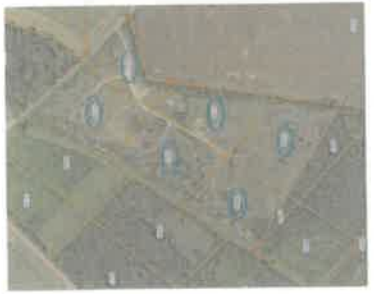
Les Pétées, parcelles cadastrées BS 345 (ex 122), 348 (ex 125), 126, 127, 128 et 129