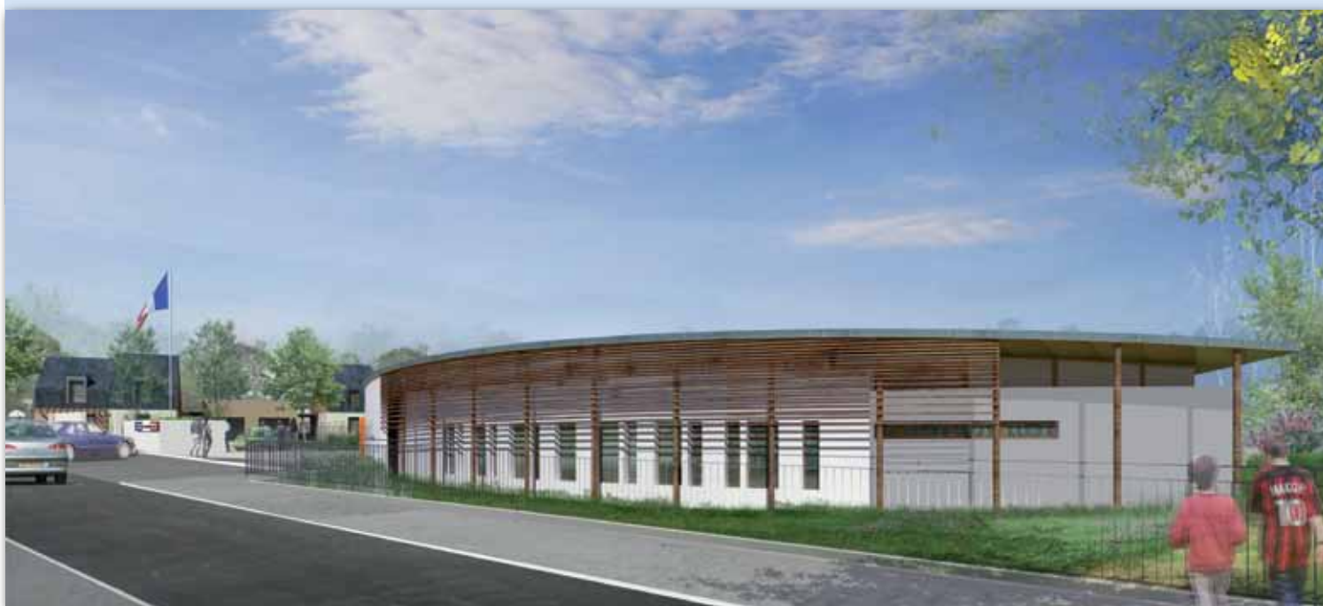
Vue du projet

La ville, propriétaire des immeubles, percevra un loyer payé par l'Etat dont le montant sera affecté au remboursement de l'emprunt.