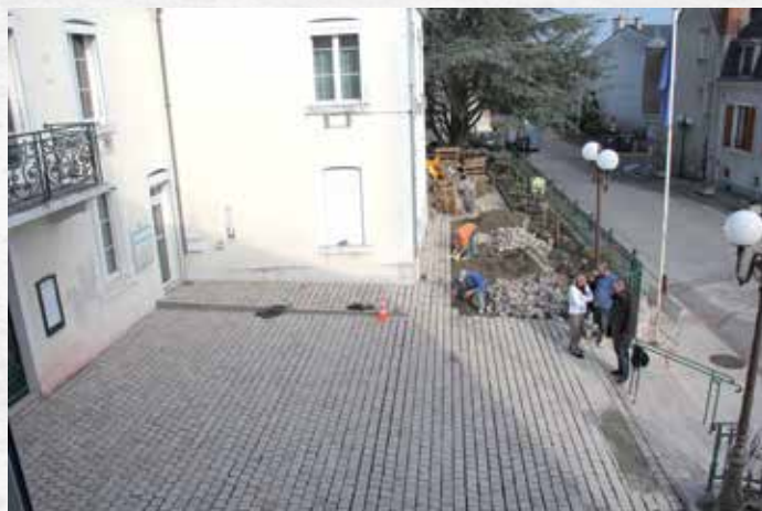
Mise aux normes : l'accès de la Mairie aux personnes handicapées a été réalisé.