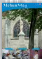
François PILLET Maire, Sénateur du Cher

- la force de ne pas baisser les bras pour préserver les progrès que nous avons faits ensemble.