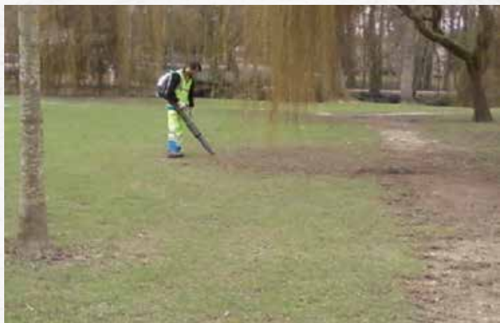
Les Jardins du Duc Jean de Berry ont été remis en état après les crues du mois de janvier.