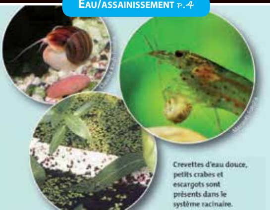
Crevettes d'eau douce, petits crabes et escargots sont présents dans le système racinaire.