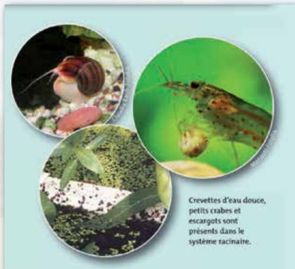
Crevettes d'eau douce, petits crabes et escargots sont présents dans le système racinaire.

Le procédé « ORGANICA » a été choisi pour ses atouts en faveur de la préservation de l'environnement : économie d'énergie, performance et sécurité du traitement, limitation de l'utilisation de produits chimiques, réduction des odeurs, intégration de l'architecture dans le paysage.