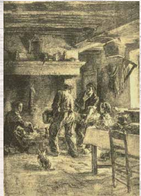
Dessin de L. Lhermitte pour le Monde illustré de 1884