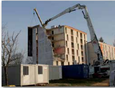
Destruction de 2 tours dans le quartier des Malandries