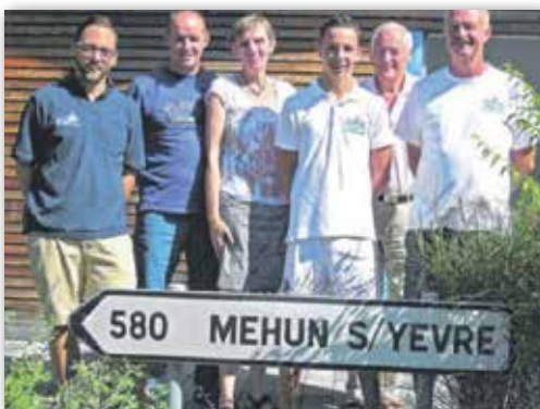
Les échanges avec Murg se poursuivent