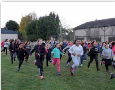
Cross des CM2 et du collège