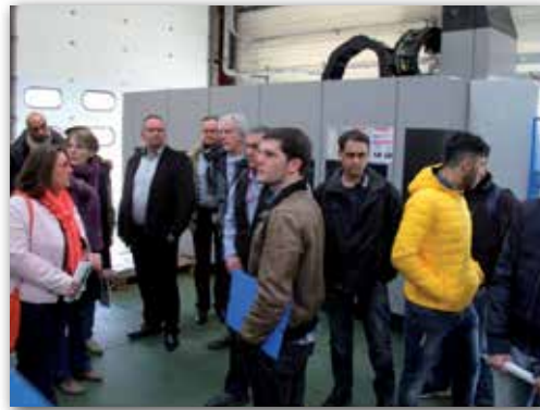
Visite d'entreprises Mehunoises par les demandeurs d'emploi