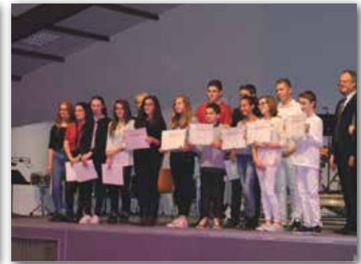
Concert de Sainte-Cécile et remise de diplômes de fin de cycle