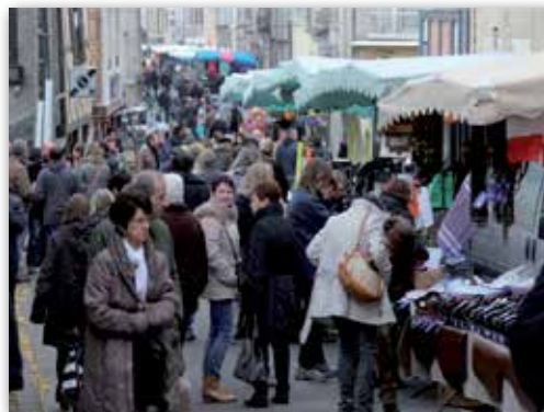
588 e foire de la Saint-André