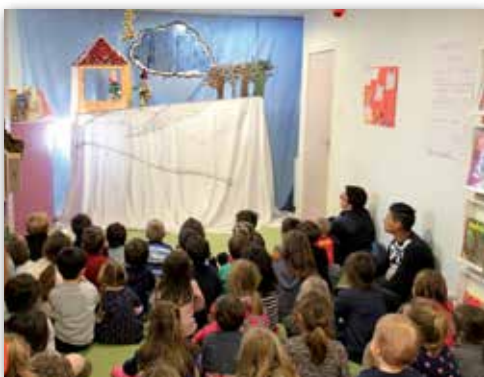
Spectacle de Noël à la bibliothèque Alain-Fournier