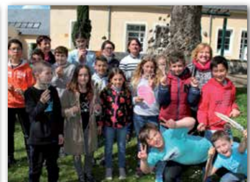
Des séjours animés au centre de loisirs