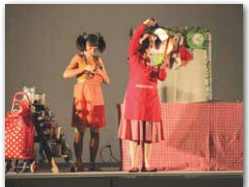
Arbre de Noël des écoles maternelles