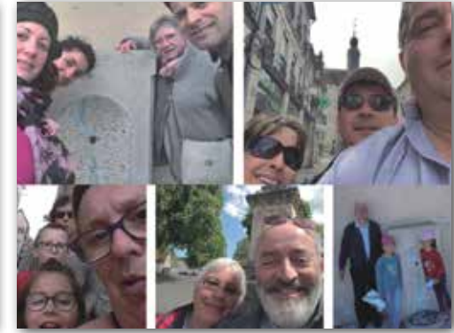
Fête des Plus Beaux Détours de France : « Rallye selfie »