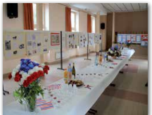
Des expositions richement illustrées à découvrir lors des cérémonies commémoratives