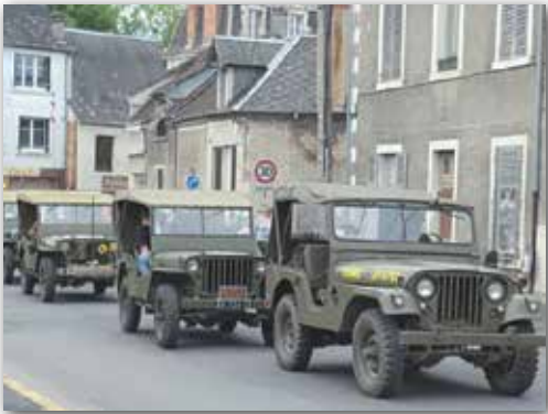
Défilé du 14 juillet