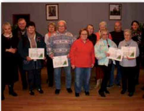
Remise des diplômes du concours des maisons fleuries