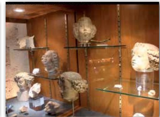
Les têtes d'anges réunies pour les journées du patrimoine