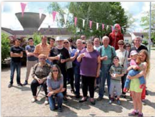
Fête du quartier de la Belle Fontaine