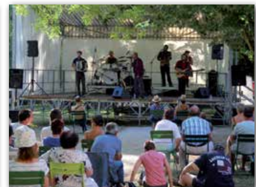
Les jardins en fête