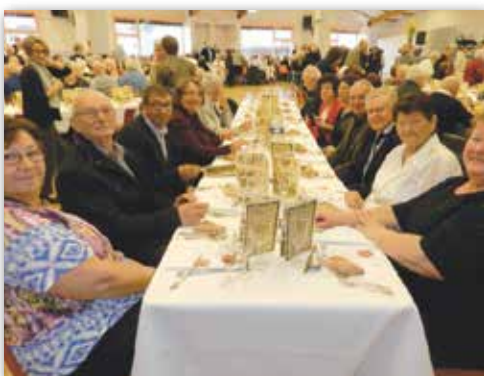
Repas des anciens sur le thème des fables de la Fontaine