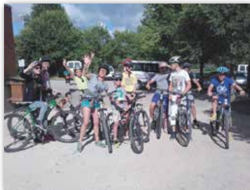
Succès des minis camps pendant le séjour d'été