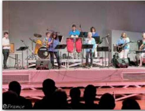
Concert « Musiques actuelles » par l'école de musique