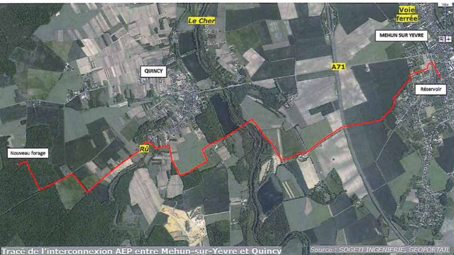
Tracé de l'interconnexion AEP entre Mehun-sur-Yèvre et Quincy

La conduite passera sous la voie ferrée, le Cher et l'autoroute et devant (à l'extérieur) le cimetière. Les travaux vont durer un certain temps et peuvent créer des difficultés de circulation. Soyez compréhensifs !