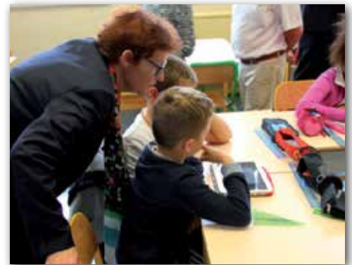
Visite du recteur d'académie dans le cadre des écoles numériques