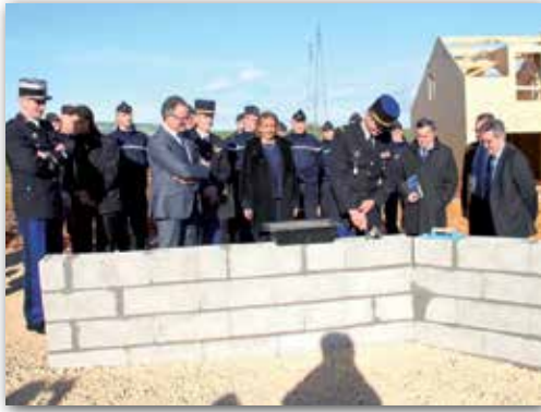
Lancement des travaux de la nouvelle gendarmerie