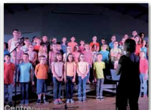
Les écoles qui chantent