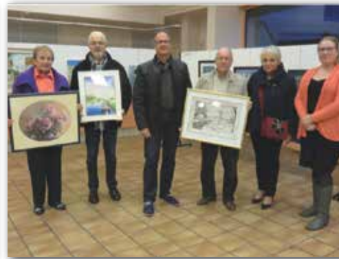
Exposition « Pinceaux Mehunois »