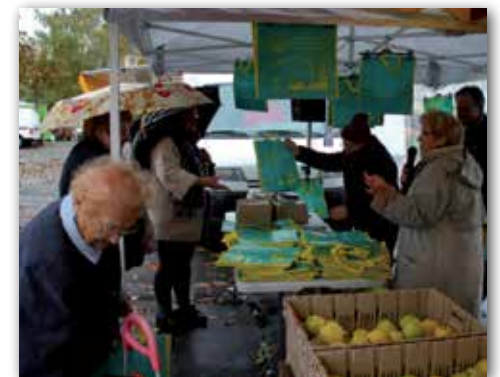
De jolis sacs distribués sur le marché