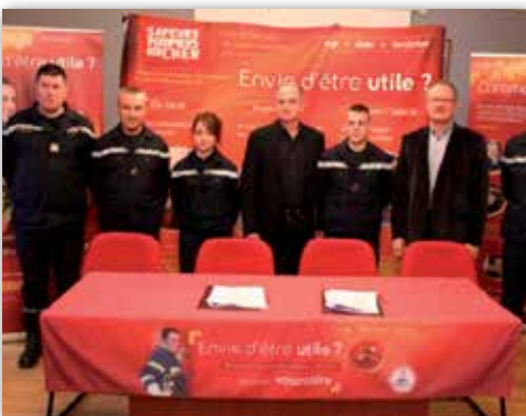
Des agents municipaux sapeurs pompiers volontaires