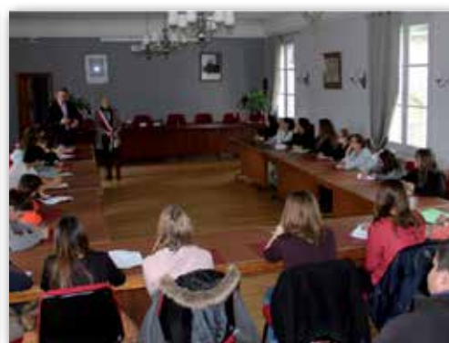
Les collégiens découvrent le fonctionnement d'une mairie