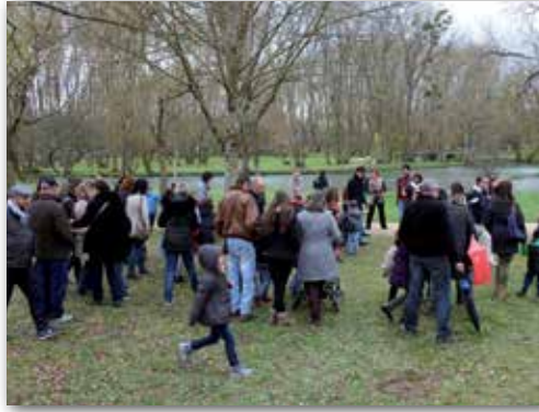
Chasse aux œufs dans les jardins du duc Jean de Berry