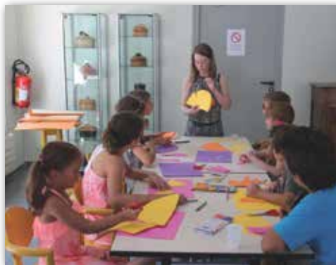
Fort engouement pour les ateliers au Pôle de la Porcelaine