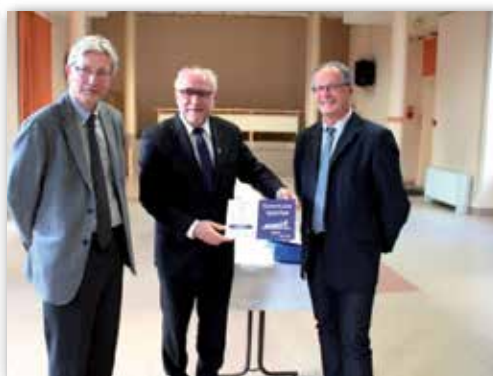
Mehun-sur-Yèvre 2 e ville la plus sportive de la région