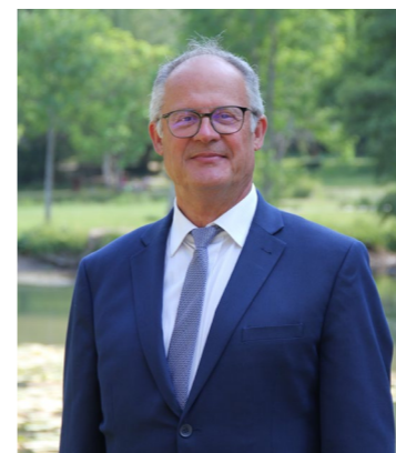
Jean-Louis SALAK Maire

MEHUN-SUR-YÈVRE 24 MARS > 03 NOVEMBRE 2024